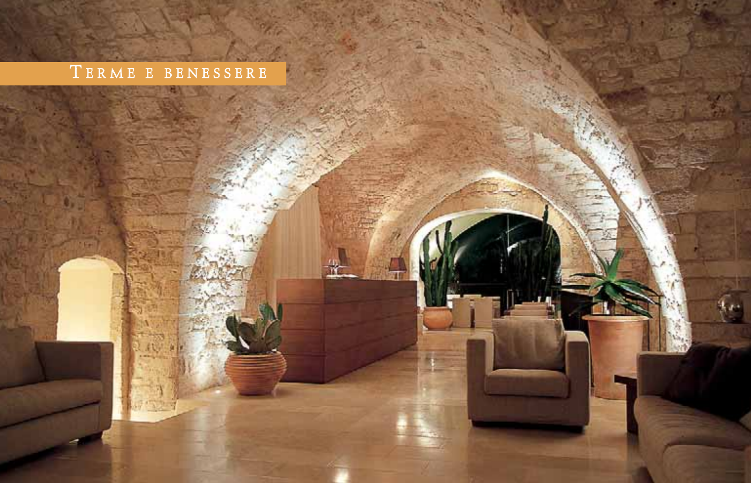
DIVANI, TAVOLI, sedute e suppellettili del Relais Culti si rifanno tutti a un ideale di sobria armonia: linee pulite, geometrie essenziali e nuance naturali che richiamano la terra e la sabbia. In basso, uno scorcio del cortile interno, regno di piante d'ulivo.

N ITORE, CANDORE, PUREZZA E SPLENDORE. Calma e levità, gioiosa letizia e soave leggerezza. Sono infinite le sensazioni evocate dal bianco. Elegante, prezioso, delicato e radioso, è per antonomasia il colore dell'abito da sposa. Intonso e immacolato lo si associa agli angeli del paradiso. In esso riposa l'infinito, il tutto e il nulla e il niente e l'onnisciente. E se fosse città, che città sarebbe se non quella Ostuni serenamente accoccolata tra cielo e mare come una nobile dama? Aristocratica nella sua semplicità e autentica nella regalità, balugina con latteo vestito contro onde smeraldine che paiono venirlle incontro. Di cuori ne ha tanti, ma uno palpita con ritmo lento e cadenzato, pian piano, quasi senza farsi sentire, ammantato com'è dalle antiche mura di una dimora signorile del Cinquecento. La Sommità, questo il suo nome, è un Relais Culti di una bellezza senza eguali. È il lusso. Ma un lusso non prepotente e ostentato. Un lusso sottile, evanescente ma mai effimero, quello che si percepisce al tatto e alla vista, che si respira, si odora e si gusta. Che coinvolge tut-