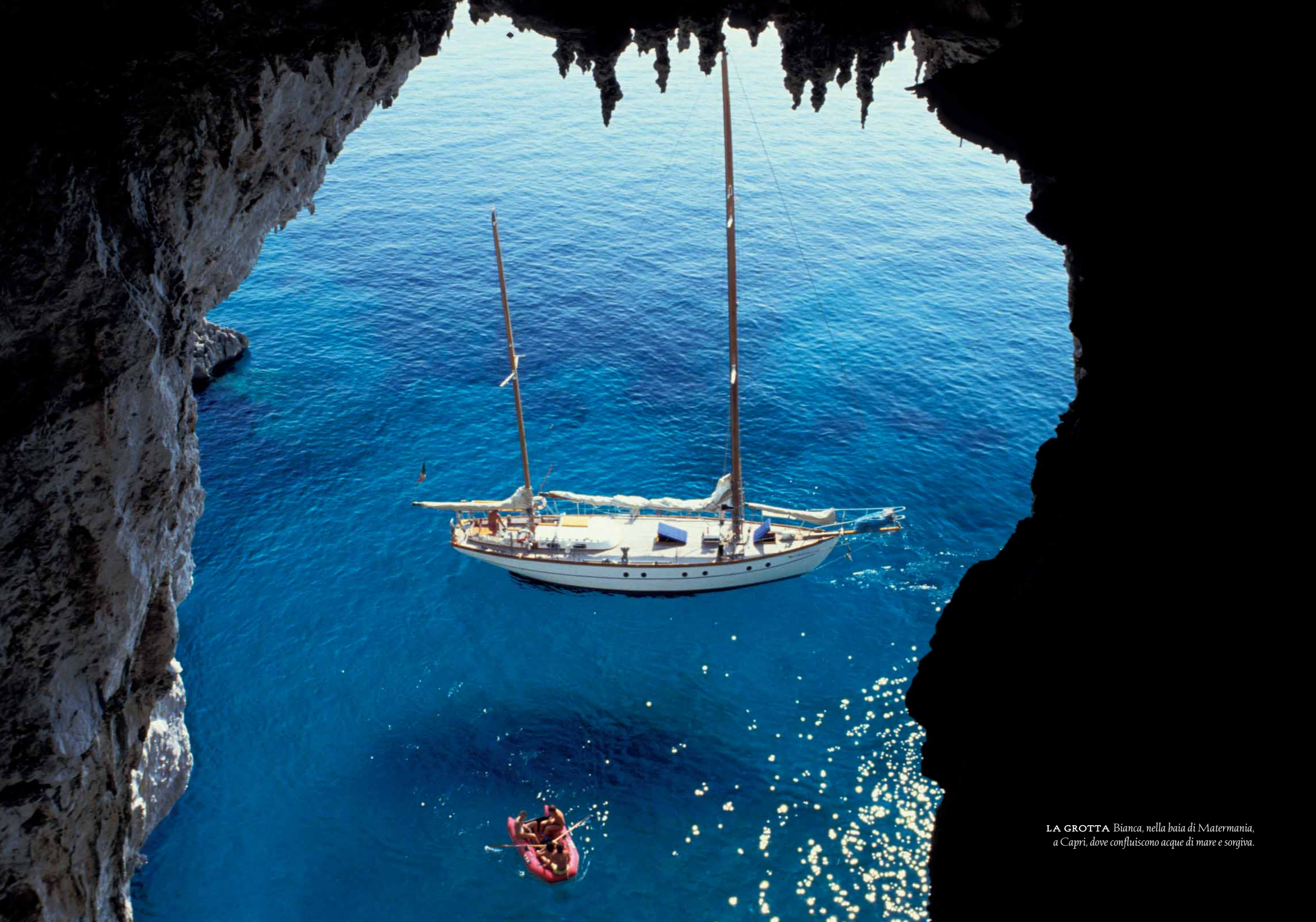
LA GROTTA Bianca, nella baia di Maternania, a Capri, dove confluiscono acque di mare e sorgiva.